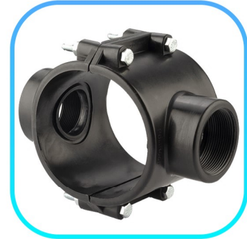
کمر بند دو انشعابه