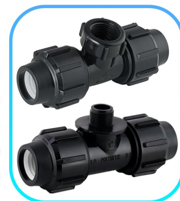
سه راه ماده سه راه نر