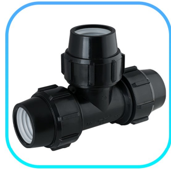
سه راه ساده