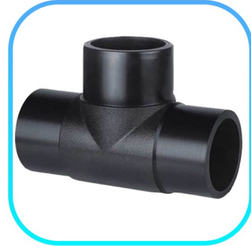
سه راه جوشی