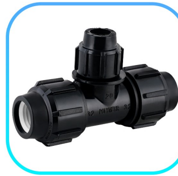
سه راه تبدیلی